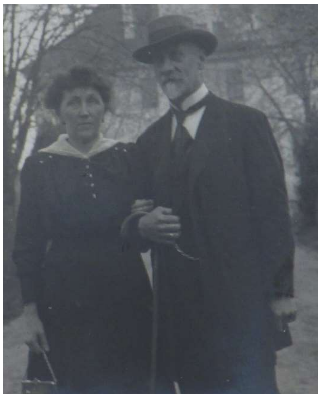
Manželé Hauptmannovi z Bechyně (1918) [1]