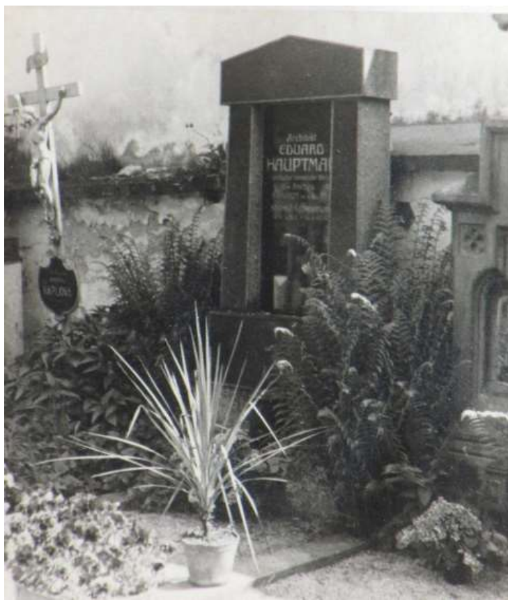
Hrob Eduarda (1944) [1]