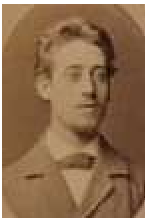
Eduard (1880) [1]