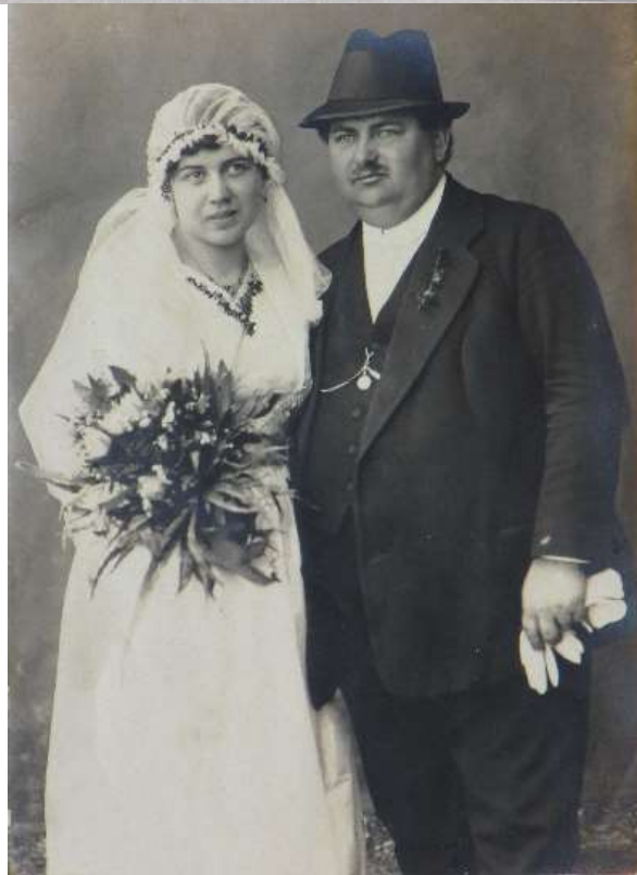
Bruthausovi svatba (1918) [1]